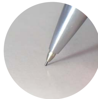
チップスライダー