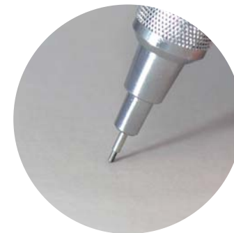
パイプスライダー